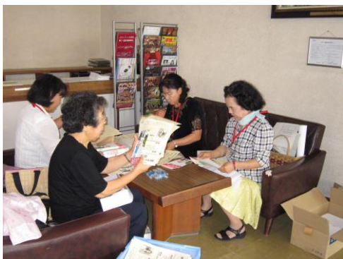
(婦人団体の皆さんで資料の準備)

参加者は、婦人団体との共催ということもあり50代から70代の女性が約7割以上を占めており、アンケートの意見にもありましたが若い年代層にもっと参加していただき、仕事と家庭の在り方について、今後の社会生活に役立てていただきたいと感じました。