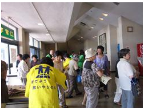
(ご来場ありがとうございます)