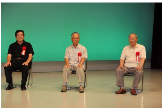
(スマイルフォトコンテスト入賞者の方々)