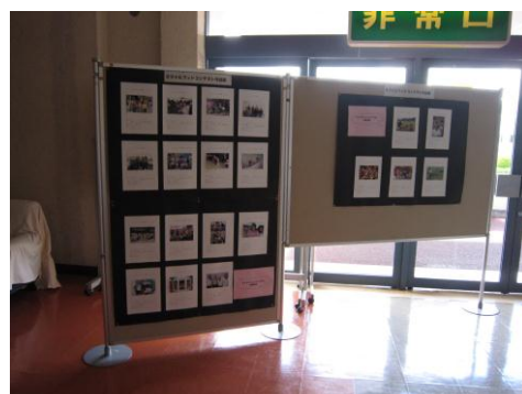
(スマイルフォトコンテスト応募作品)