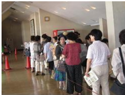
(開場前から長蛇の列)