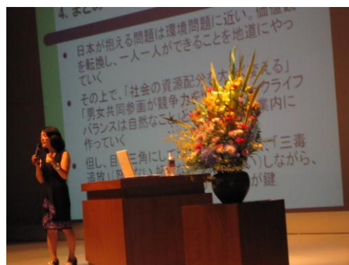
(ワークライフバランスとは！)

たくさんの方々にご来場いただき、盛会裏のうちに終了できましたこと感謝申し上げます。