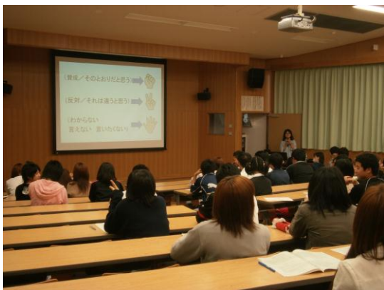
【田尻さくら高等学校】